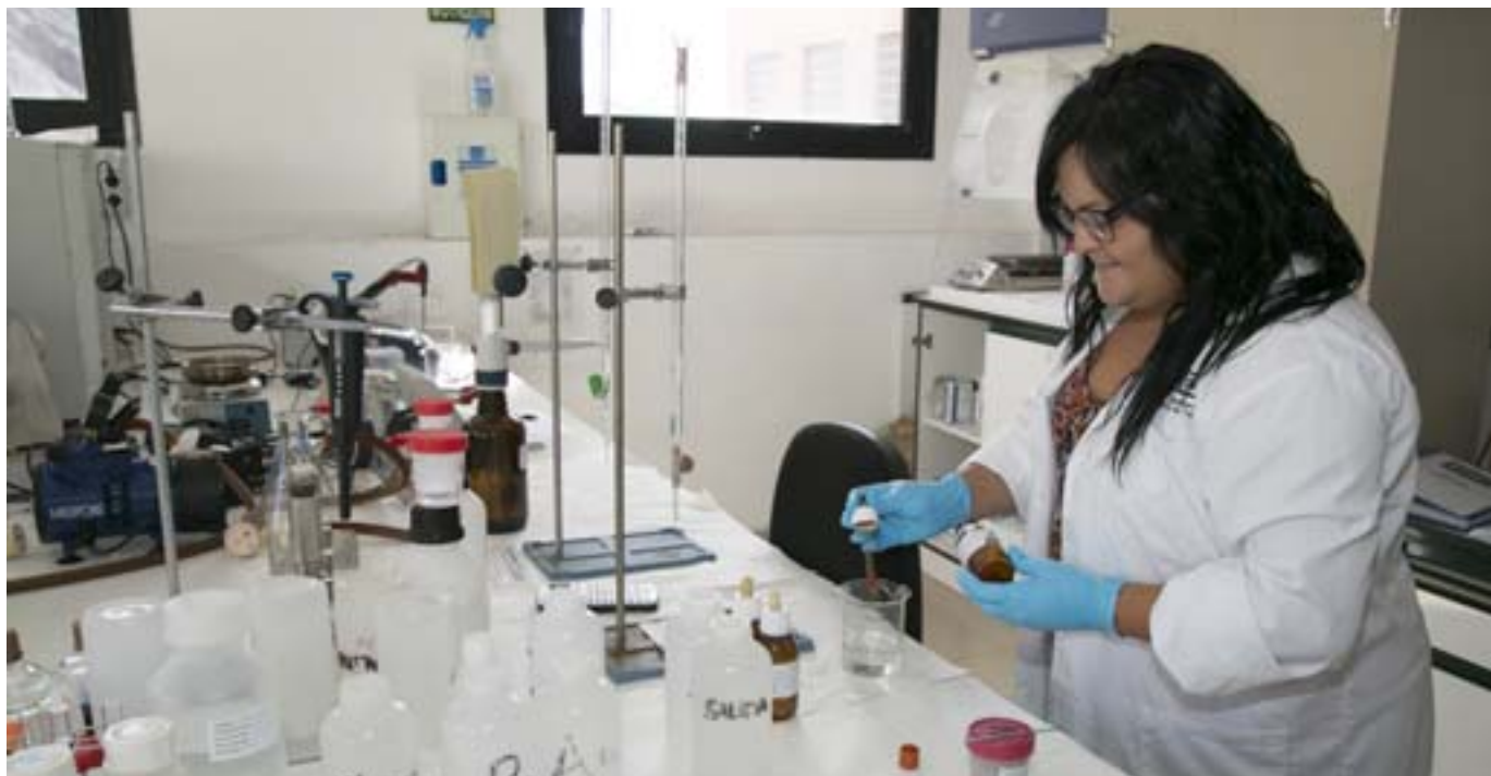
EMMASA aporta confianza y transparencia a la sociedad en la gestión diaria del ciclo integral del agua.